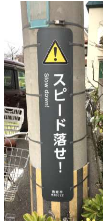
マナーサイン/注意喚起サイン 電柱添架型 (単独・集約)